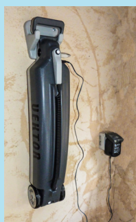
Recharge du Vektor 1

Vektor 1 enroule très facilement et sans effort votre couverture à barres en moins de 3 minutes. Une fois la batterie chargée grâce à son chargeur, Vektor 1 est autonome et se pilote à l'aide de sa télécommande.