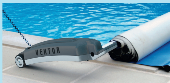
Principe de fonctionnement du Vektor 1.

Vektor 1 enroule très facilement et sans effort votre couverture à barres en moins de 3 minutes. Une fois la batterie chargée grâce à son chargeur, Vektor 1 est autonome et se pilote à l'aide de sa télécommande.