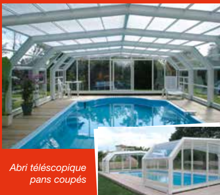
Abri télescopique pans coupés

Quel que soit son principe, une fois l'abri entièrement et convenablement fermé, le bassin doit devenir inaccessible aux enfants de moins de cinq ans sur tout le périmètre y compris les parties adossées ou accolées lorsqu'il y en a. L'abri ne doit pas comporter d'éléments de na-